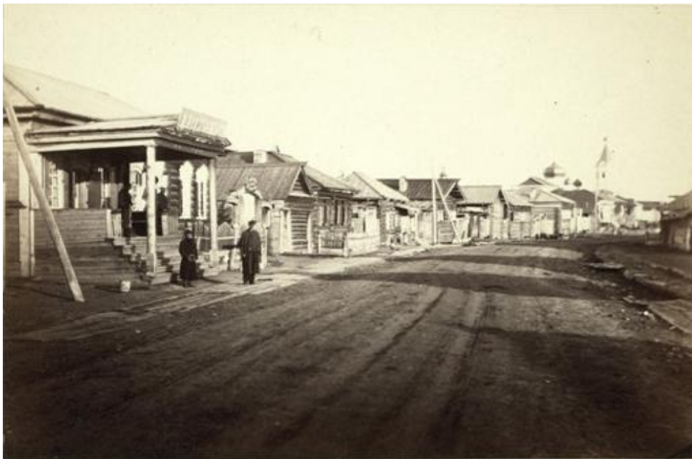
Кутулик 1885год, ул. Большая

Широко и привольно раскинулся поселок Кутулик в степных просторах Аларского района. С одной стороны вдоль поселка стремительной линией мчится Московский тракт, с другой – шумит железная дорога. Как писал наш земляк – драматург Александр Вампилов: «Мимо нашей школы проходит Московский тракт, а дальше за Нижней улицей, за огородами, за лугом – железная дорога. Когда мы отсиживали свои последние уроки, машины по тракту шли реже, а составы на подъеме против больницы ползли медленно, с неровным стуком. Теперь без машины не обходится ни одной минуты, а поезда летят легко между серыми опорами электросети».