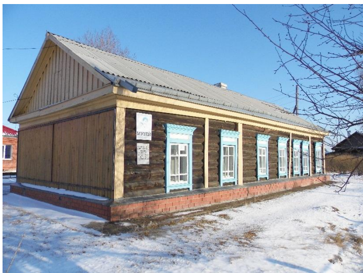
Музей драматурга А.В. Вампилова.

В селе была пересыльная этапная тюрьма, где останавливались все, проходившие в Иркутск и далее в Забайкалье политические и уголовные преступники. Тюремный комплекс состоял из двух бараков, которые были рассчитаны на 100-200 человек. В 1930 году один из бараков перестроили под жилье для учителей средней школы, где жил Александр Вампилов (драматург, прославивший Кутулик на весь мир) со своей матерью, сестрой и братьями. Сейчас в этом доме находится музей Александра Вампилова. До сегодняшнего дня сохранился и дом начальника тюрьмы.