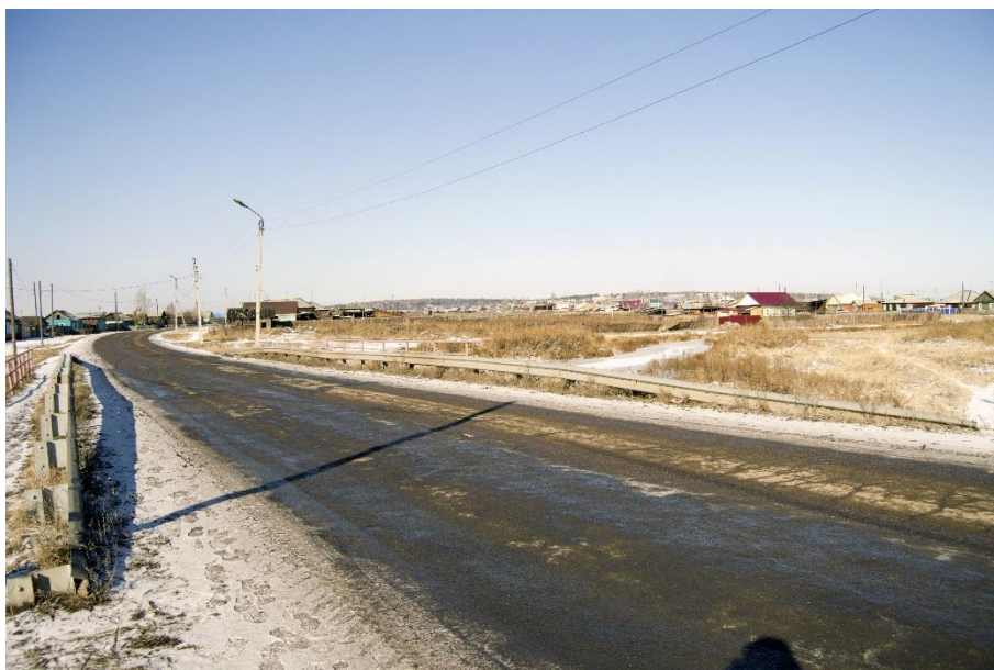
Вид на «Барабу» с моста.

1922 году перенесен в Кутулик, так как поселок занимал географически центральное место в аймаке и играл большую роль в экономической и культурной жизни. К этому времени в селе проживало смешанное население, численностью 1562 человека. В Кутулике жили русские, украинцы, евреи, татары. Татарская диаспора заселилась на окраине поселка, которая называлась «Барабой». Была построена мечеть, которая не сохранилась. Появились татарские и еврейские кладбища. В начале 30- годов в Кутулике был образован татарский колхоз «Янга Ил», затем русский – имени Ф.Э.Дзержинского. После войны они были расформированы.