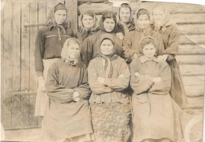
Доярки деревни Мучная Степь. 1955 г.

Как же трудно было смотреть на колыбель своего детства последний раз, стараясь запомнить все до мелочей и знать, что больше ты этого никогда не увидишь! Все останется лишь в памяти, да будет приходить во снах.