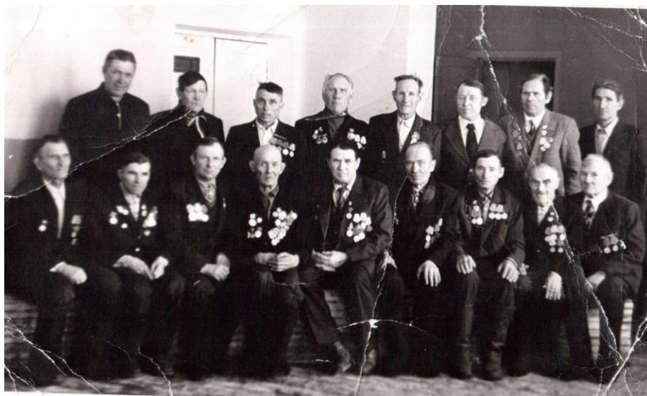
Ветераны Великой Отечественной войны п. Ангарский. 1985г.

В годы строительства Братской ГЭС деревни Мучная Степь и Русский Нельхай попали в зону затопления, и жители этих деревень построили новый поселок на возвышенном месте и дали ему название Ангарский.