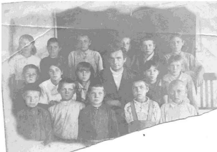
Ученики начальной школы деревни Мучная Степь. 1946 г.

Старожилы с ностальгией вспоминают природу, окружавшую их в детстве. Река была быстройтечной и своенравной, она была намного уже, чем сейчас. Возле деревень находились острова: Березовый, Хабутай, Шантэй, а маленькие островки называли Иманушками 21 .