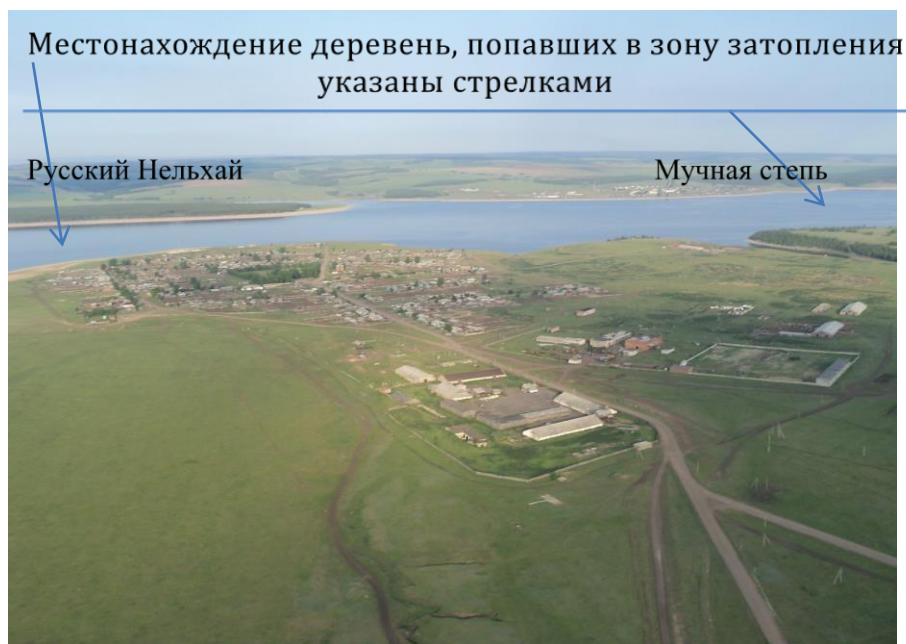
Поселок Ангарский. Аларский район. Иркутская область. Вид сверху (фото 2013г. Автор Дьячков Алексей Геннадьевич)

Поселок Ангарский расположен на берегу великой сибирской реки Ангары. Это самый молодой поселок Аларского района, появился он на свет в годы великих строек и преобразований в стране, в 1960 году. 1 «Родители» нашего поселка деревни Русский Нельхай и Мучная Степь в годы строительства Братской ГЭС попали в зону затопления и остались на дне рукотворного моря. Но история поселка Ангарский берет свое начало с возникновения именно этих двух деревень.