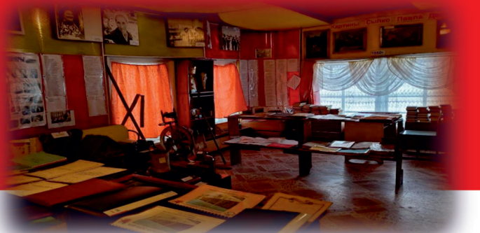
Музей коммуны с. Идеал