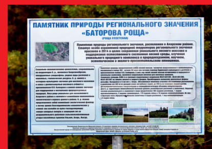
Памятный знак тайше П.П.Баторову