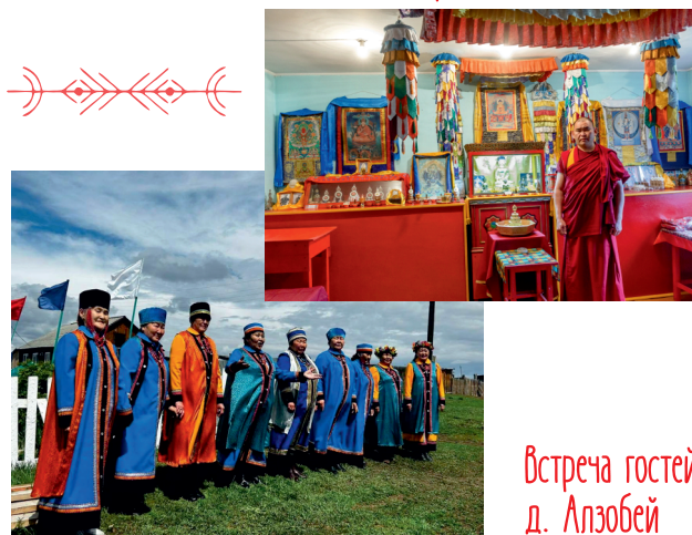
Встреча гостей д. Алзобей